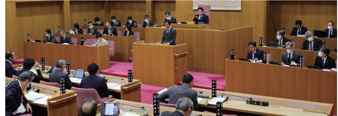
「ガザ地区における人道目的の停戦等の実現を求める決議」 全会一致で日田市議会が決議する（3月26日）

加を見すえ、高齢者間での所得再分配機能を強化し、低所得者の保険料上昇を抑える必要がある」とし、年間所得が420万円以上で引き上げました。介護保険料は、所得などによって差があります。これまでの9段階から13段階に細かく分かります。昨年度の第9段階（所得320万円以上）の上に、所得420万円以上を対象とした10から13段階をつくり、保険料を引き上げます。第1から3段階に位置づけられている低所得者（38.8%）は、保険料が下がります（上のグラフ）。