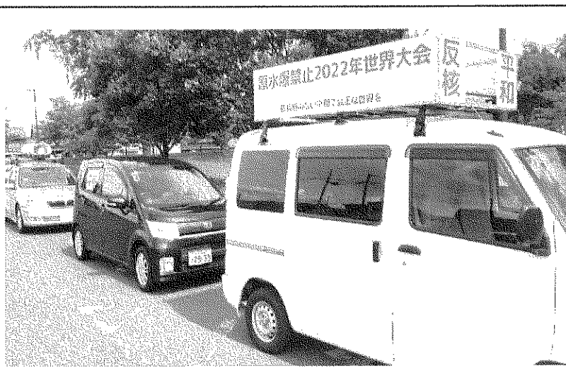
「広島・長崎を繰り返すな」と宣伝

原水爆禁止日田地区協議会は、県内の平和行進と連携して、日田・玖珠の自治体首長や議長に要請し署名やペナント等の協力をお願いしました。4日の世界大会の参加や9日の長崎集会には、オンラインで合わせて16名が参加し学習しました。また9日の長崎原爆投下の日に平和行進として宣伝カーで市内をめぐり「核兵器の廃絶」を訴えました。