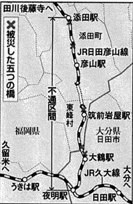
◀JR日田彦山線の不通区間

市長は、第4回日田彦山線復旧会議(4月23日)で「JR九州の3つの復旧案を自治体(福岡県、大分県、東峰村、添田町、日田市)が持ち帰り、沿線住民の意見を聞